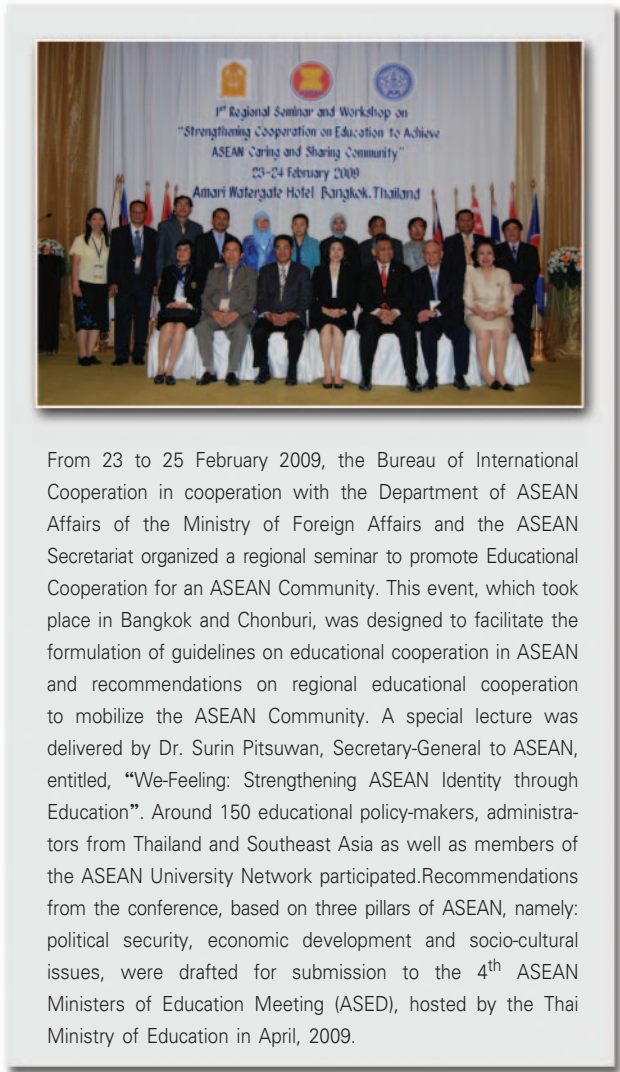
From 23 to 25 February 2009, the Bureau of International Cooperation in cooperation with the Department of ASEAN Affairs of the Ministry of Foreign Affairs and the ASEAN Secretariat organized a regional seminar to promote Educational Cooperation for an ASEAN Community. This event, which took place in Bangkok and Chonburi, was designed to facilitate the formulation of guidelines on educational cooperation in ASEAN and recommendations on regional educational cooperation to mobilize the ASEAN Community. A special lecture was delivered by Dr. Surin Pitsuwan, Secretary-General to ASEAN, entitled, "We-Feeling: Strengthening ASEAN Identity through Education". Around 150 educational policy-makers, administrators from Thailand and Southeast Asia as well as members of the ASEAN University Network participated. Recommendations from the conference, based on three pillars of ASEAN, namely: political security, economic development and socio-cultural issues, were drafted for submission to the 4 th ASEAN Ministers of Education Meeting (ASEM), hosted by the Thai Ministry of Education in April, 2009.

* พิธีเปิดการประชุมจัดขึ้นในวันที่ 23 กุมภาพันธ์ 2552 โดยนางสาวนริศรา ชวาลตันพิพัทธ์ รัฐมนตรีช่วยว่าการกระทรวงศึกษาธิการ ได้กล่าวต้อนรับผู้เข้าประชุมและกล่าวถึงความสำคัญของการสร้างประชาคมอาเซียนเพื่อร่วมกันแก้ไขปัญหาและเผชิญสถานการณ์ท้าทายของภูมิภาคในปัจจุบัน พร้อมทั้งการให้ความสำคัญต่อ