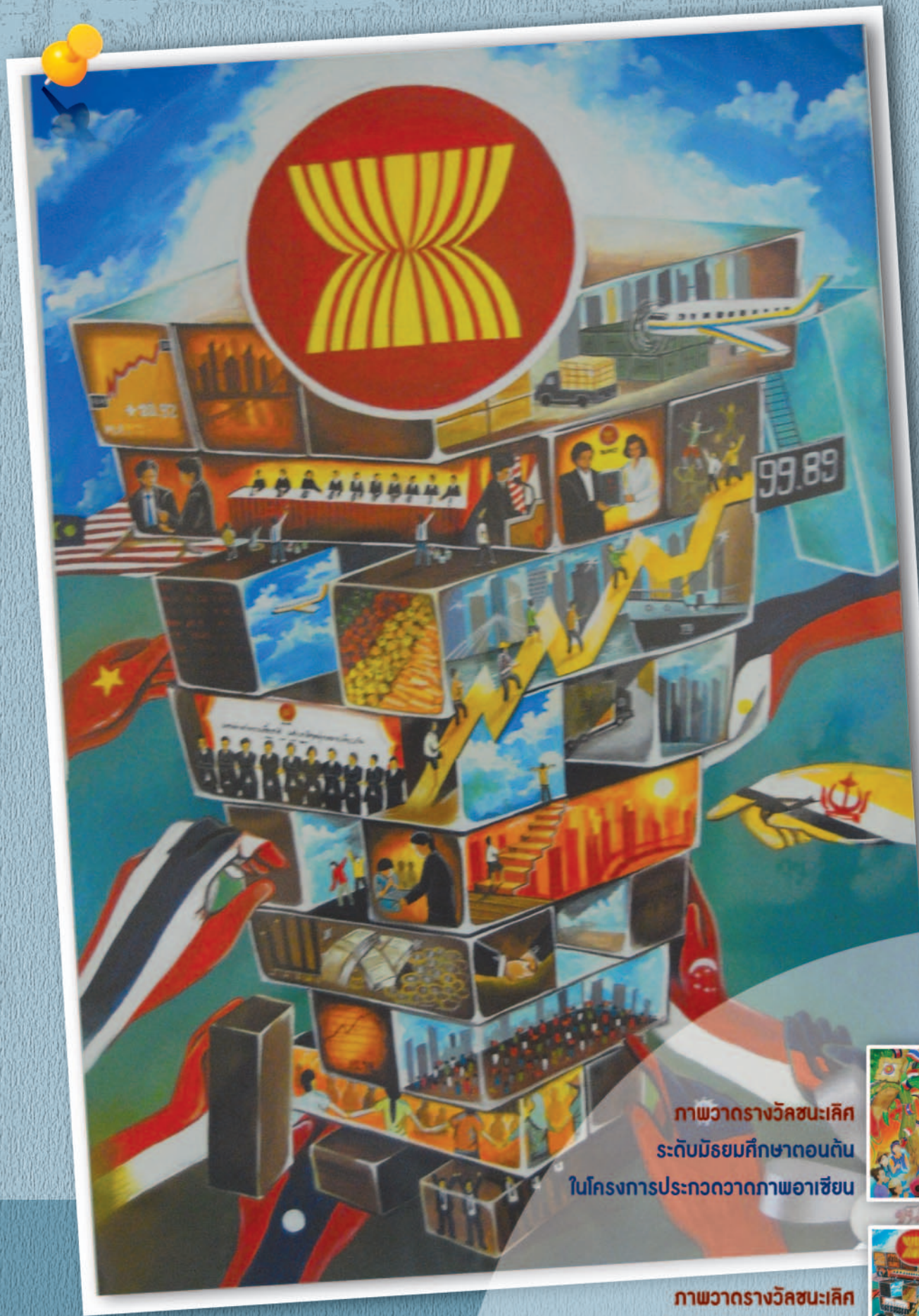
ภาพวาดรางวัลชนะเลิศ ระดับมัธยมศึกษาตอนต้น ในโครงการประกวดวาดภาพอาเซียน