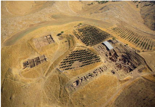
୨) Göbekli Tepe (Turkey) Criteria: (i)(ii)(iv)