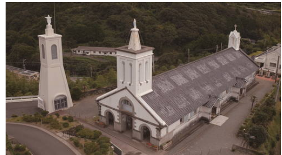
୩) Hidden Christian Sites in the Nagasaki Region (Japan) Criteria: (iii)