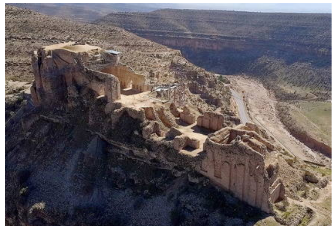
୧୧) Sassanid Archaeological Landscape of Fars Region (Iran Islamic Republic of) Criteria: (ii)(iii)(v)