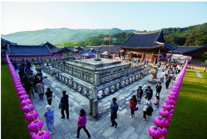
୧୦) Sansa, Buddhist Mountain Monasteries in Korea (Republic of Korea) Criteria: (iii)