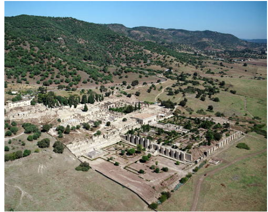
୧) Caliphate City of Medina Azahara (Spain) Criteria: (iii)(iv)