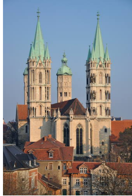
୯) Naumburg Cathedral (Germany) Criteria: (i)(ii)