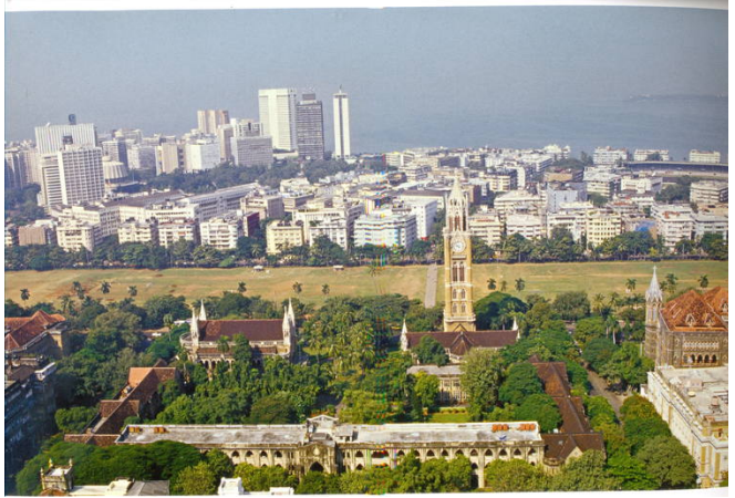
๑๓) Victorian Gothic and Art Deco Ensembles of Mumbai (India) Criteria: (ii) (iv)