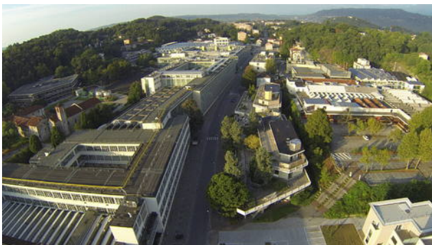
୪) Ivrea, industrial city of the ୧୦th century (Italy) Criteria: (iv)