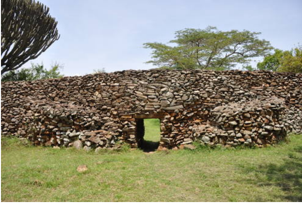
๑๒) Thimlich Ohinga Archaeological Site (Kenya) Criteria: (iii)(iv)(v)