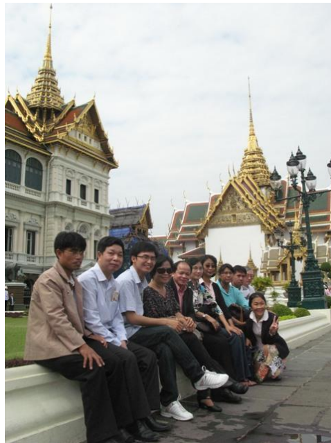
กลุ่มความร่วมมือกับองค์การระหว่างประเทศ สำนักความสัมพันธ์ต่างประเทศ สป. มีนาคม ๒๕๕๔